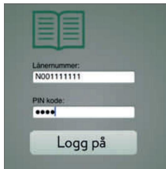
Innlogging ved hjelp av lånernummer og pin-kode.

Vi vil om ikke lenge la Encripto gjennomføre en ny test, og igjennom det verifisere at sikkerheten i løsningen er på det høye nivået vi skal ha.