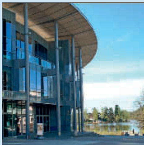
Oppegård bibliotek ligger i 2. etasje i Kolben.