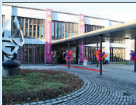
Gjøvik bibliotek og Oppland fylkesbibliotek.

Her er bilder av noen av bibliotekene som har startet å bruke Bibliofil i løpet av året