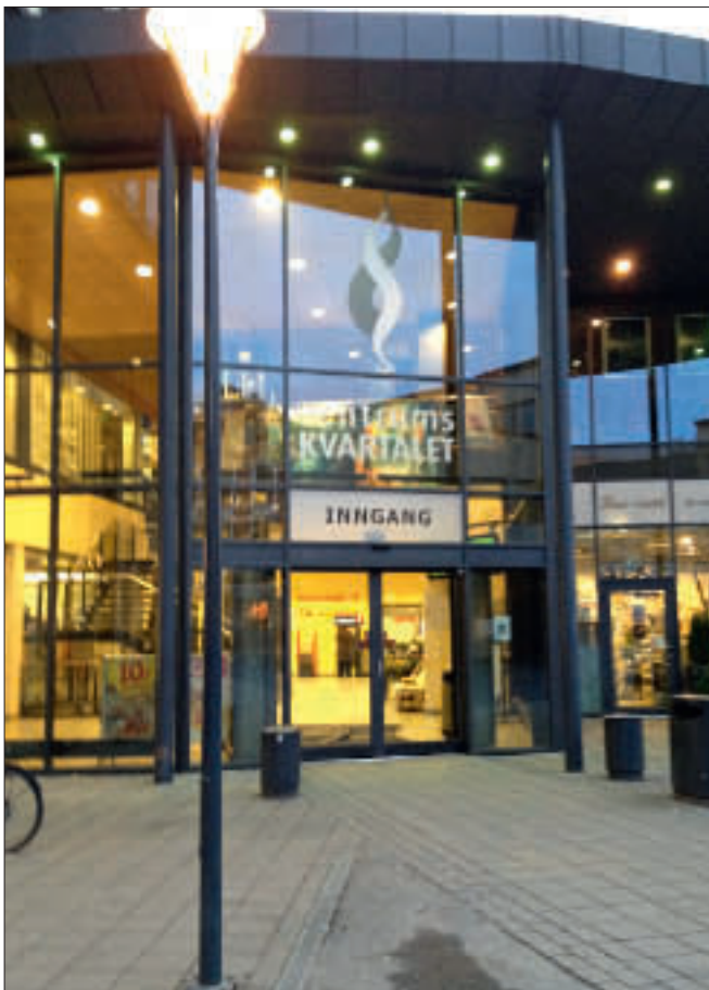
Ringerike bibliotek holder til i Sentrumskvartalet i Hønefoss.

Vi ønsker Ringerike bibliotek velkommen som ny kunde! Sammen med Ringerike fengsel startet de opp med Bibliofil 15. november. Vi håper Ringerike vil bli godt fornøyd med Bibliofil.