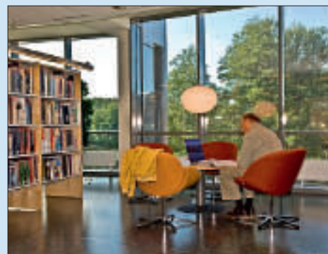
Oppegård bibliotek, foto: Kåre Fintland.