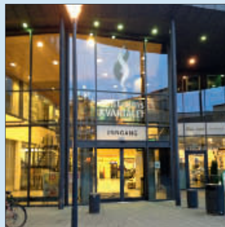
Ringerike bibliotek ligger i Sentrumskvartalet i Hønefoss.